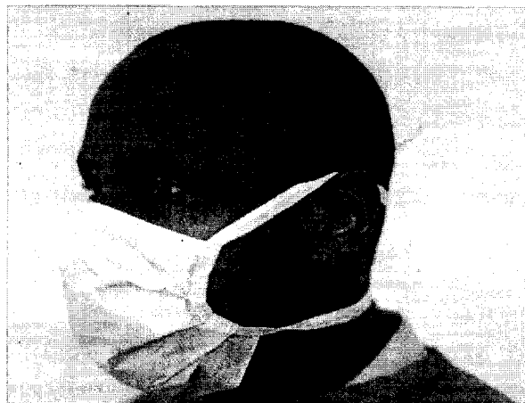
Рисунок 2. Установка металлического носового зажима маски